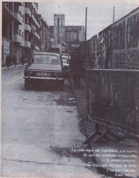
La calle sigue sin visibilidad, a la espera de que un accidente irreparable le ponga solución. Se dijo, que era cosa de días, y ya hace un año.

"La calle sigue sin visibilidad, a la espera de que un accidente irreparable le ponga solución. Se dijo, que era cosa de días, y ya hace un año".