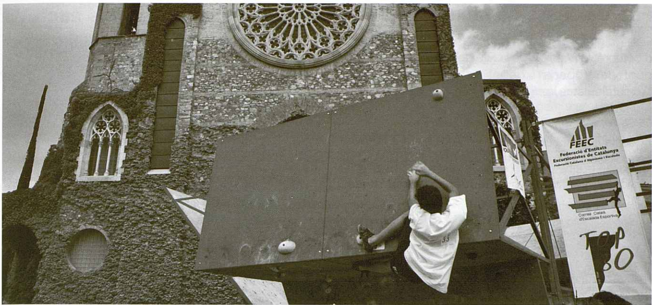
Un escalador en acció al búlder que es va instal·lar a la plaça de l'Església