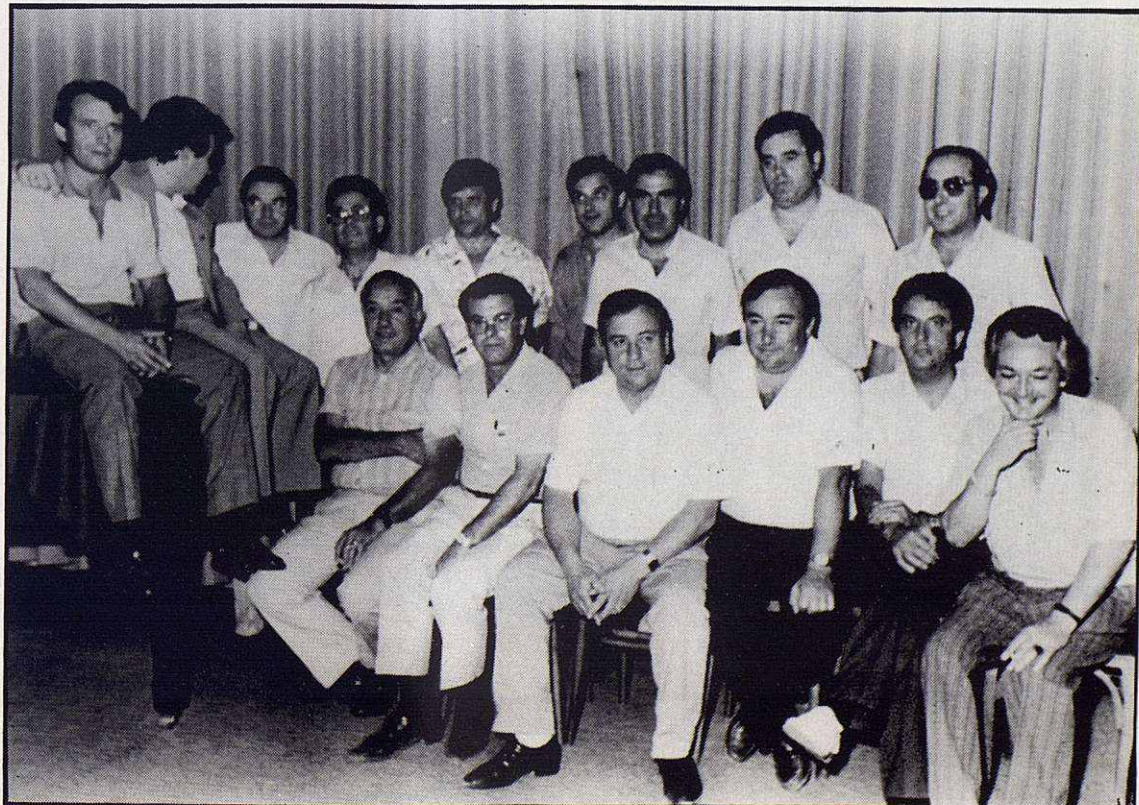
Componentes de la nueva Junta Directiva.