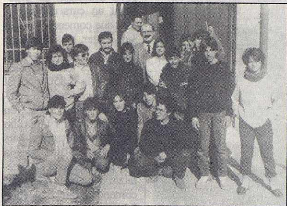
L'alcalde de Granollers amb els joves.