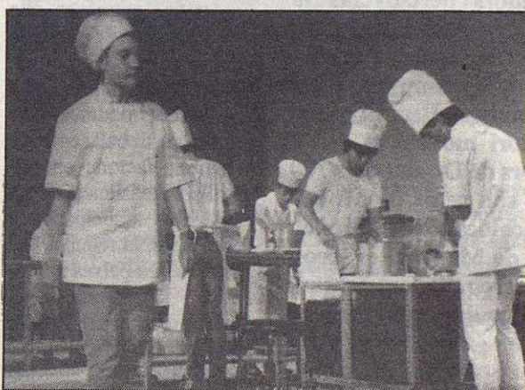
Taller de teatre de l'any passat «La Cuina».

Aquest cicle teatral s'inicià el divendres 17 de gener amb «La cançó de les balances» de Josep Maria Carandell; va seguir amb «La comèdia de l'olla» de Plaute, i adaptació lliure de Francesc Nel.lo (dimecres 22 de