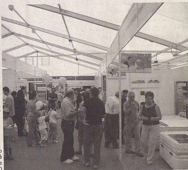
Numeroso público visitará los stands de FIMO

traerá visitantes a FIMO y otro que hará un recorrido por Gallecs, con el objetivo de potenciar este espacio rural.