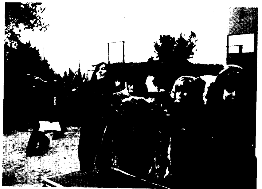
El tiro no es exclusivo, ni mucho menos, del sexo masculino. Buena prueba la patentizan las señoras; gentiles tiradoras de reconocida puntería.