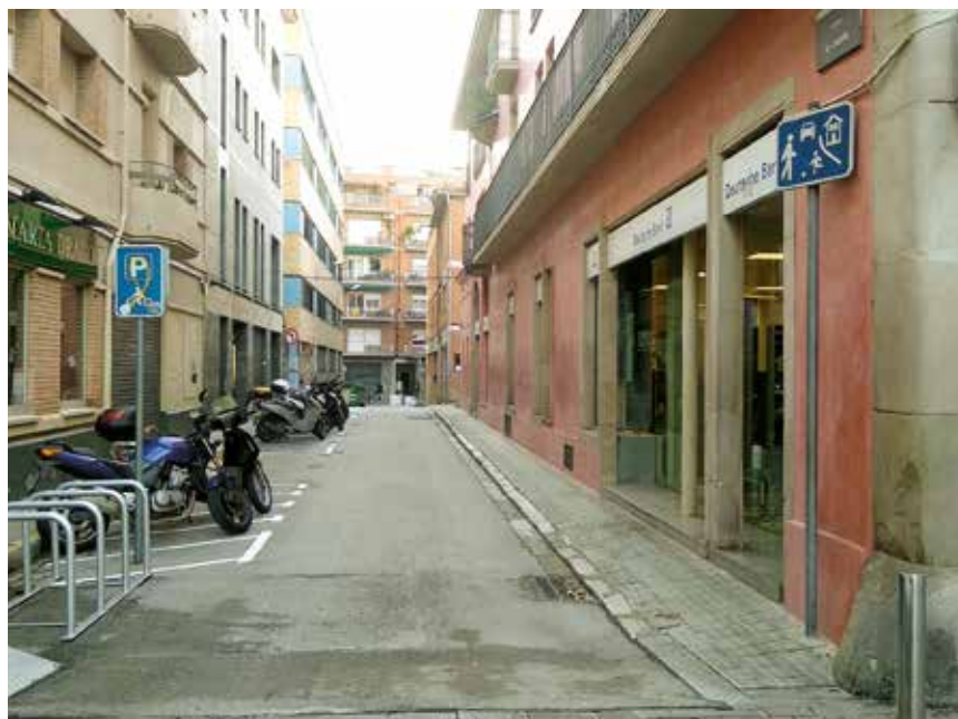
El carrer Castella, situat entre la plaça de la Corona i el carrer de Barcelona, serà de calçada única

Els del 2021 també seran uns "pressupostos verds". Amb una dotació de 556.500 euros, s'aposta per la transició energètica principalment en dos espais: el Palau d'Esports i Roca