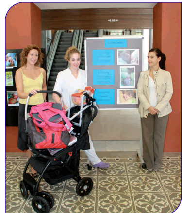
Un moment del lliurament de premis del sorteig