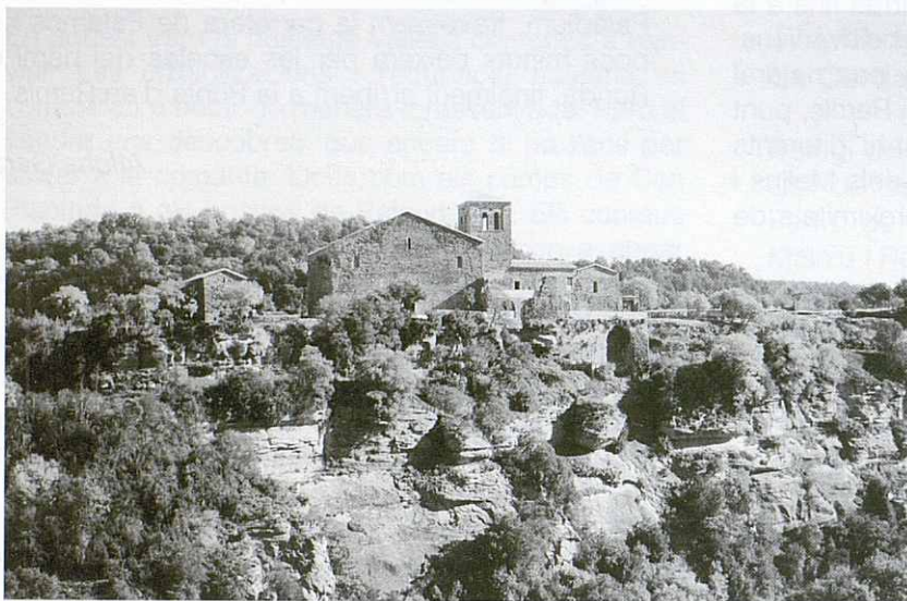
Sant Pere de Casserres (vista general).

Pugem a l'altre costat del marge i sortim una pista ampla i còmoda, ben fressada, fa un pla i amunt suau. És un lloc de bon passar. Amb poques difi-