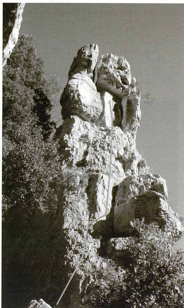
Via St. Jordi