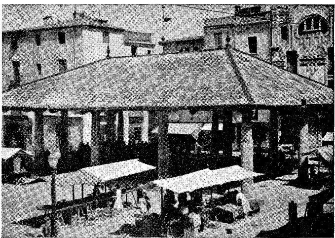
La «Porxada», símbolo del Granollers comercial y productor, se levanta más esbelta depurada de aquellos elementos superpuestos que la afeaban (persianas, verja, etc.). Rendimos el homenaje de nuestro recuerdo y nuestra oración a aquellos conciudadanos que bajo su techo cayeron, sin pena ni gloria, víctimas de la criminal resistencia roja.