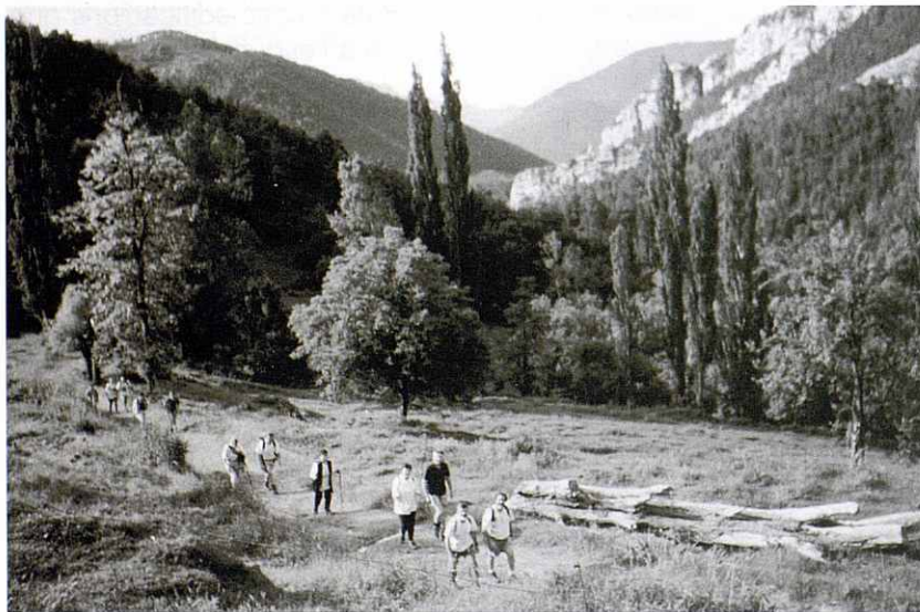
Camp de Ventolana, camí de pujada a la Canal de la Serp.

A les 6:30 sortim de Granollers i a les 9:00 arribem al Pàrking (1.060 m), on s'inicia la pista que porta al poble de Greixer, i comencem a caminar. Al cap d'una hora parem a esmorzar a la zona denominada Camp de Ventolana (1.400 m). Després d'un bon esmorzar iniciem la pujada a La Canal de La Serp, canal llarga i de moltes giravoltes que juntament amb la calor, per l'avançament de l'hora, es va fer molt pesada.