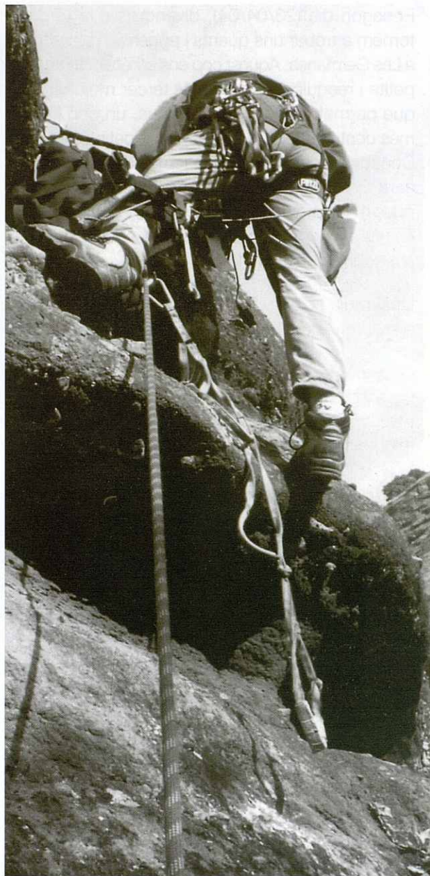
Detall dels primers metres de l'aresta