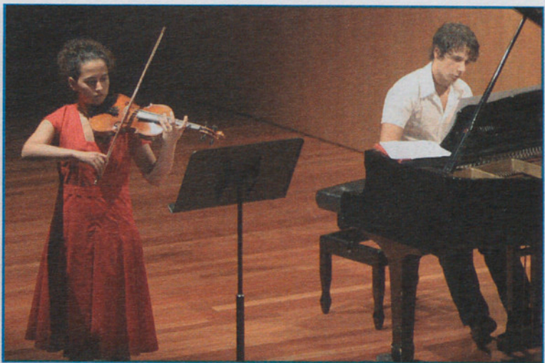
Concierto de los alumnos de la Escola Josep Maria Ruera.