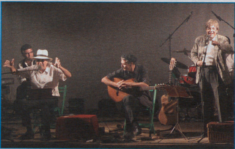
El humor y la música de Quico, el Celio....