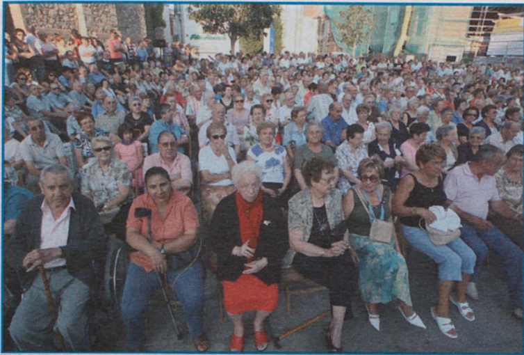
Las habaneras siempre congregan mucho público.