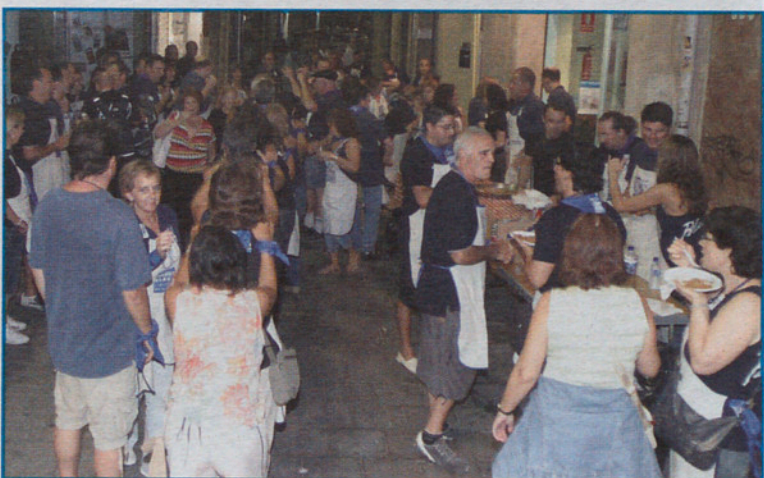
Fósiles Blaus, a lo mejor sí, pero bailongos, también.