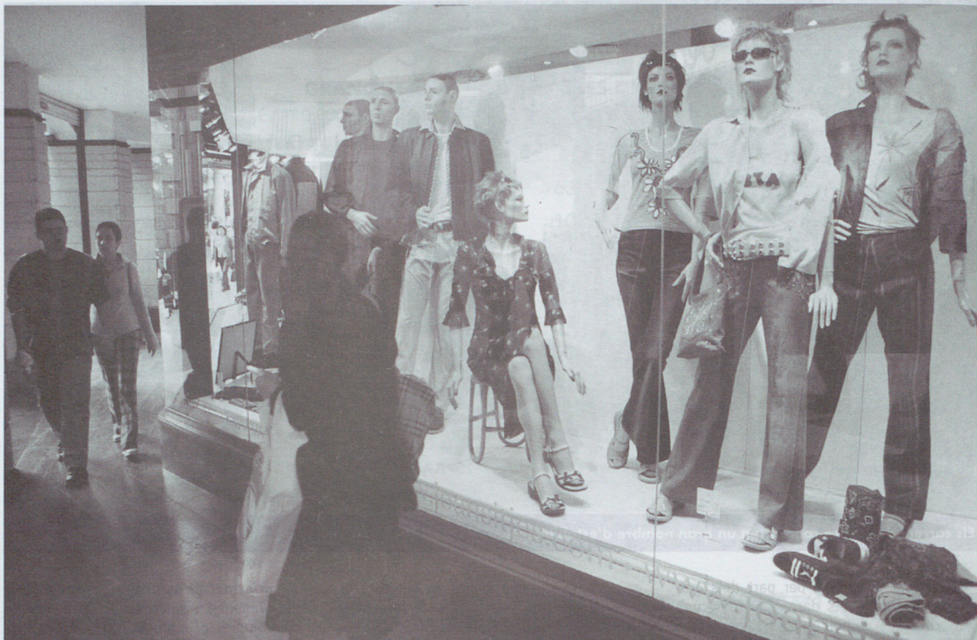
Les botigues s'han convertit en un gran aparador.

llers ho fa motivada especialment per la varietat d'establiments que hom hi pot trobar (59%) i l'elevada gamma de productes (30%).