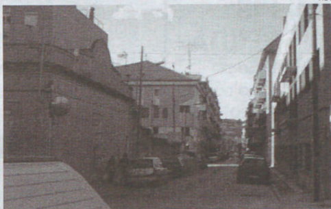
La profesionalización a todos los niveles.

Y al hacer referencia a estos profesionales nos referíamos, por su importancia y trascendencia, a los agentes de la propiedad inmobiliaria, e indicábamos que era la única forma de saber diferenciar el ojo de la paja, en un sector en el que no falta el intrusismo, tan presente en diversos sectores económicos. Por lo que parece los primeros en darse cuenta de la presencia de este intrusismo generalizado han sido los verdaderos agentes inmobiliarios y han decidido –cosa importante para los ciudadanos de a pie y futuros clientes de sus despachos- poner en marcha