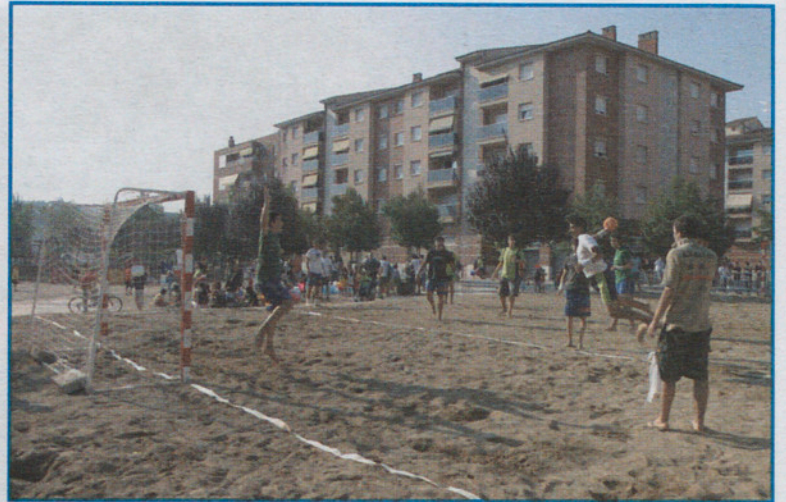
...Y en Granollers hay playa.