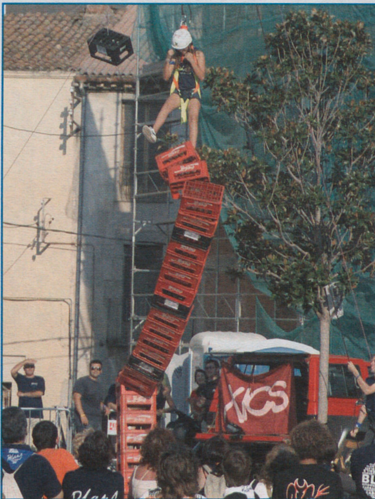
Estas cajas están pero que muy altas.