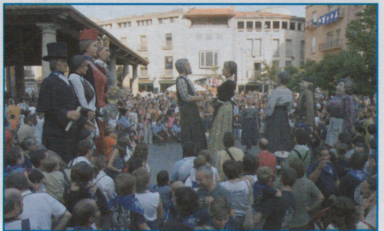
Los gigantes en plena demostración de sus poderes.