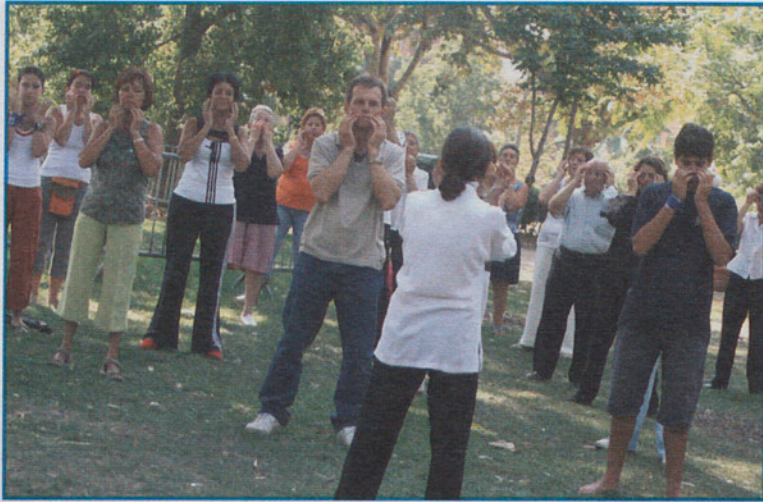
En el nombre del Tai-Txi, tranquilidad...