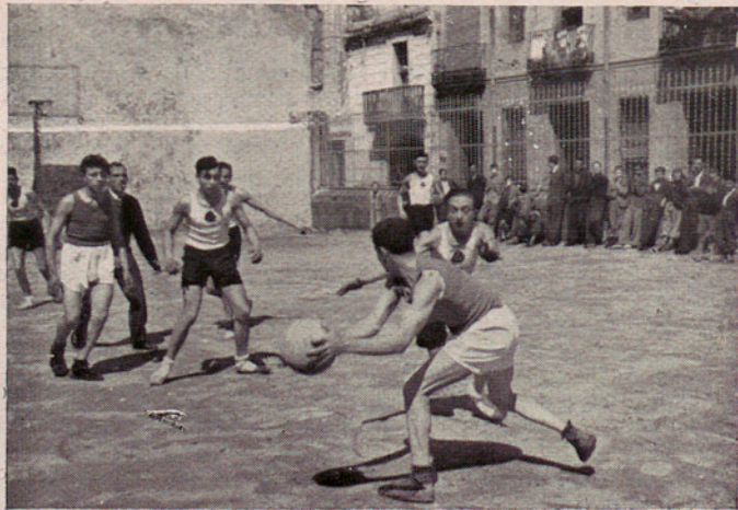
Dos fases que demuestra lo de emotivo que encierra el baloncesto.