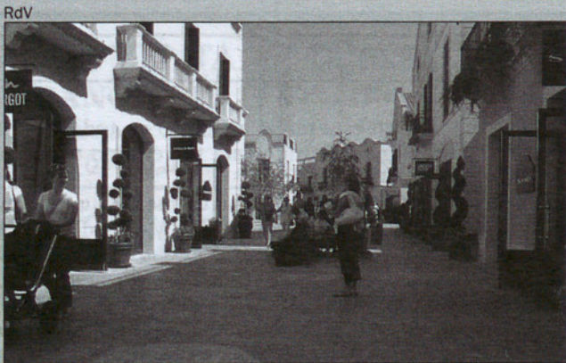
La Roca Village.