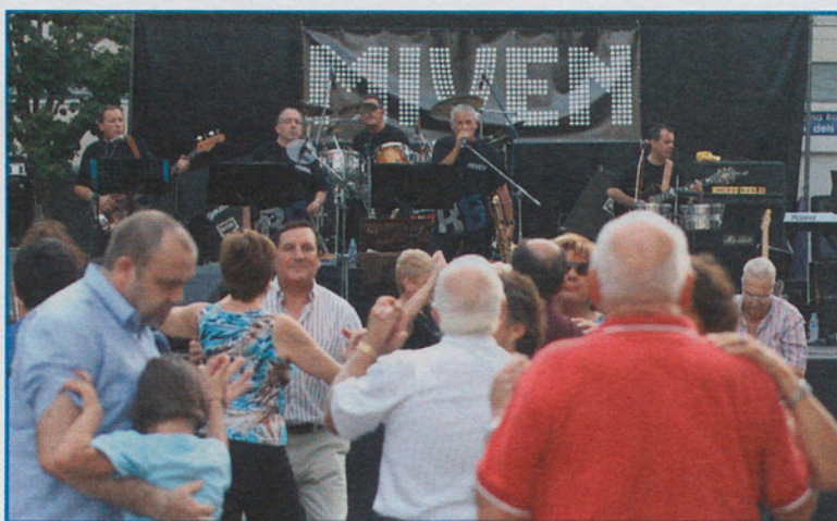
Los Miven, orquesta de Granollers con largos años y mucha marcha.