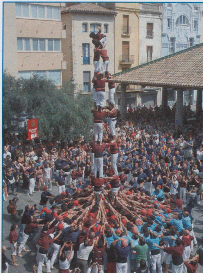
Los Xics no pudieron con las torres de ocho, pero sí con las de siete.