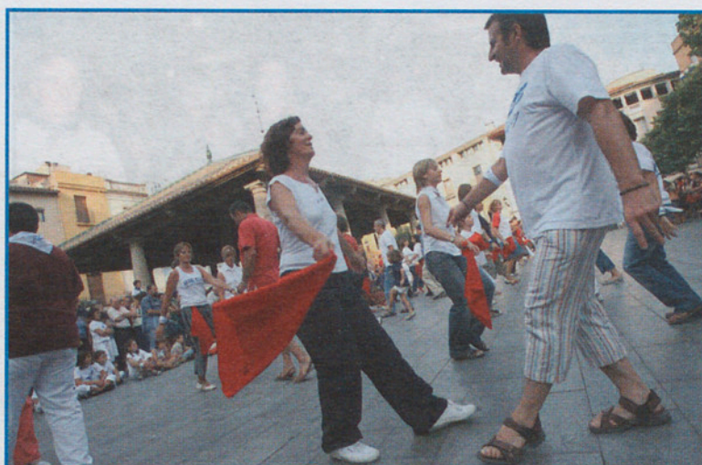
El Ball de les Donzelles...