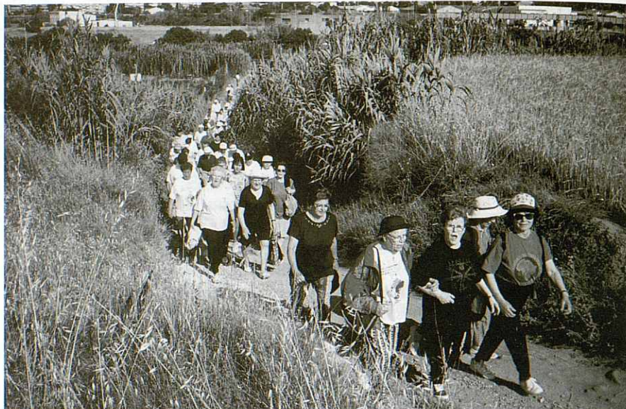
Excursió Gent Gran 1998.

a Corró d'Amunt pel mig del bosc; anàrem a parar fins al camp de tir de les Franqueses, ens esperava el senyor Eladi i companyia que ja ens havien preparat un entrepà amb una botifarra calenta i que tothom va poder remullar amb uns quants porrons de vi. Després vàrem emprendre la marxa cap a Corró d'Avall, passàrem pel turó de les Mentides, fins arribar a Granollers. La gent s'ho va passar molt bé, tothom pensava en el proper any, per tornar-hi.