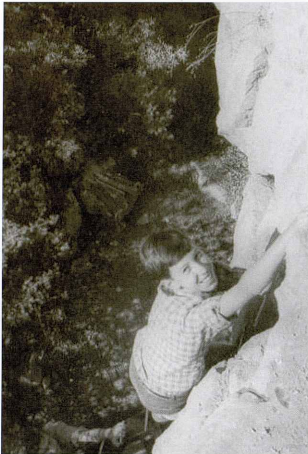
Cova Nogueroles; any 1968