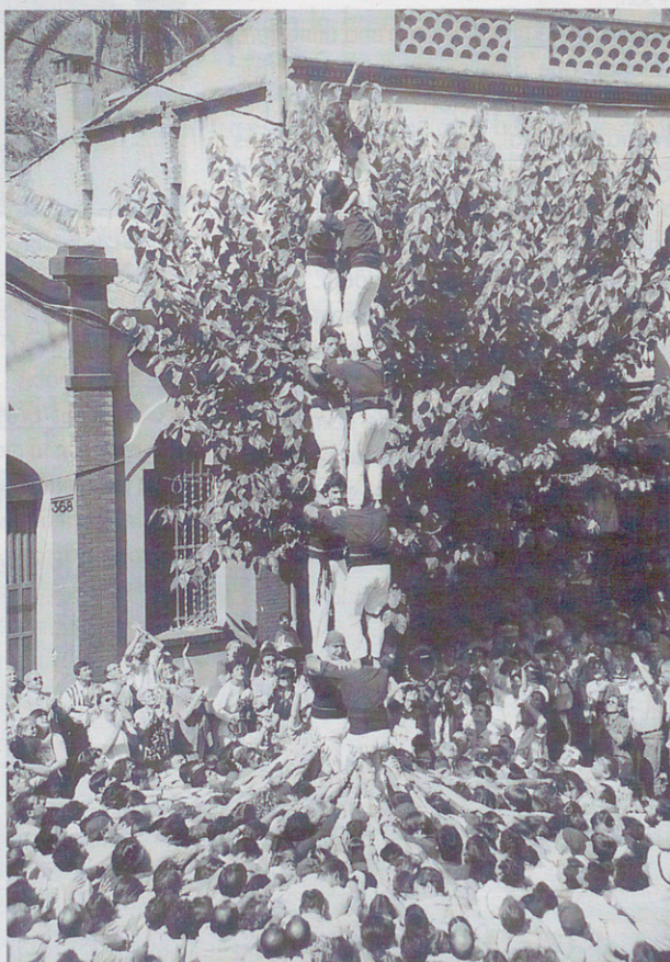
Torre de set descarregada a Vallirana (22/9/96), al segon intent, Ufi

Existeix el gran inconvenient econòmic. Qüestionar-se definitivament la compra d'un local és un tema que a partir d'avui requerirà dos condicions per tal que el projecte arribi a bon port: