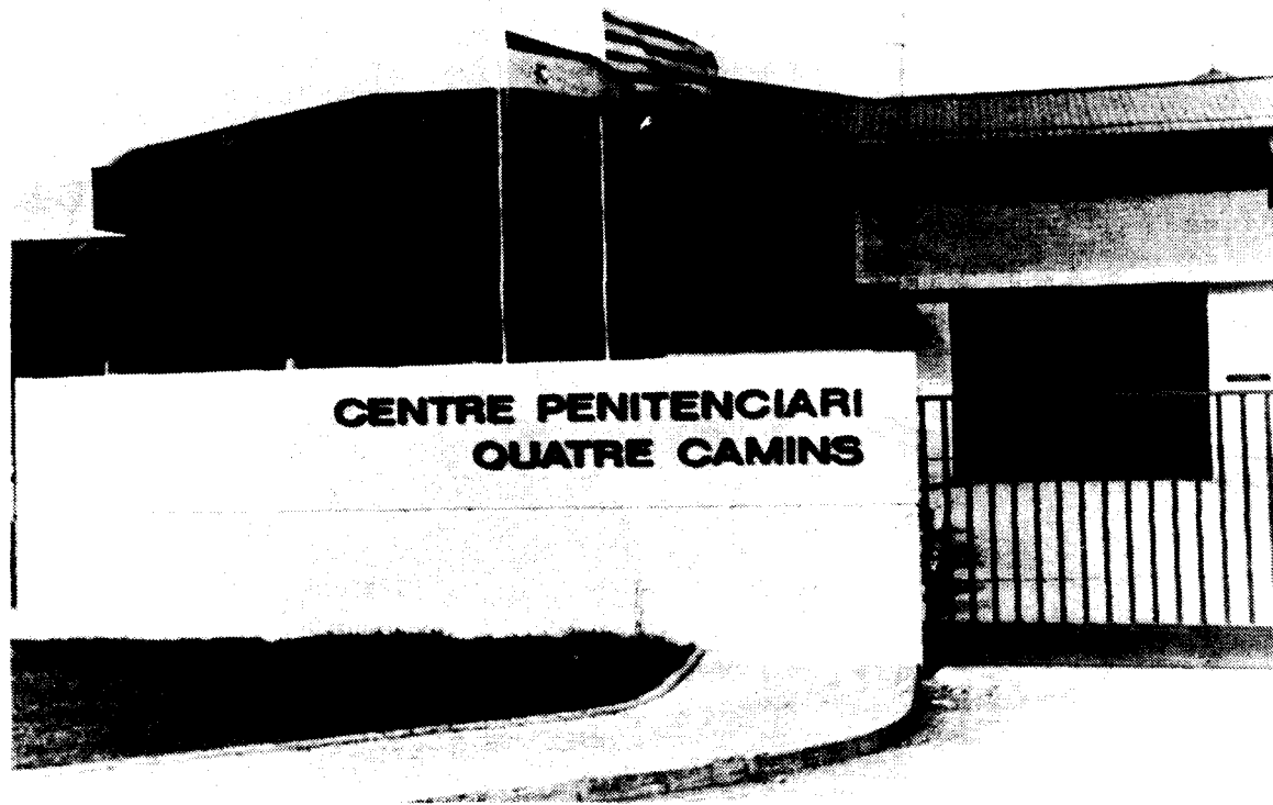
La presó de Quatre Camins s'haurà de fer càrrec del dipòsit de detinguts en un període de tres mesos.

El grup municipal de Convergència i Unió es va abstenir en la votació d'aquesta sol·licitud de l'ajuntament com a Administració actuant en matèria de sanejament. El partit de l'oposició considera que encara es manté el litigi entre Consorci per a la Defensa del riu Besòs i el Consell Comarcal per obtenir més competències en àmbit de sanejament al Vallès Oriental.