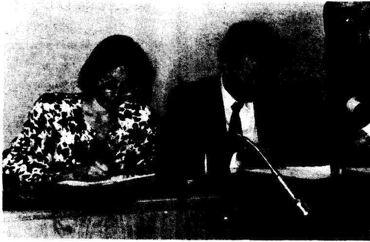
Montserrat Tura i Antoni Comas durant la signatura del conveni

El Conseller de Benestar Social, Antoni Comas, i l'alcalde de Mollet, Montserrat Tura, van signar dijous al matí un conveni de cooperació em matèria de serveis socials mitjançant el qual la Generalitat aporta aquest any 20 milions per a l'acabament de la primera fase de les obres de millora de l'escola per a disminuïts psíquics Angel de la Guarda. La Generalitat també s'ha compromès a construir, en uns terrenys cedits pel municipi, un nova residència per a la gent gran en un màxim de temps de 3 anys.