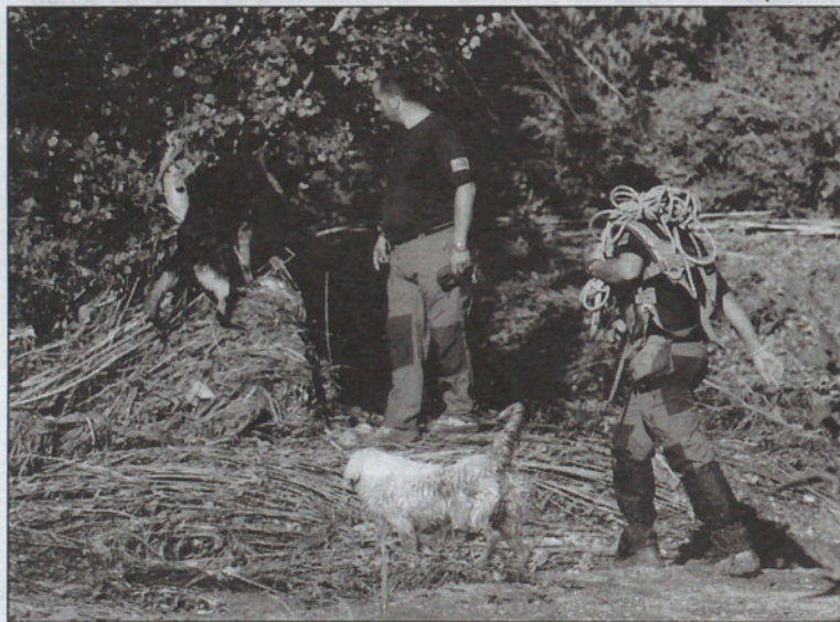
Miembros de Protección Civil rastrearon el río desde Cardedeu a La Roca con ayuda de perros adiestrados.

A las cinco de la tarde el cielo, totalmente negro, anunciaba el diluvio que en menos de una hora dejó en algunas poblaciones como Sant Celoni 61'6 litros y medio por metro cuadrado, 55 (73 según TV3) en Cardedeu y en Cànoves, más de 28 en Santa Maria de Palautordera, 50'7 en Sant Feliu de Codines y más de 45 litros por metro cuadrado en Bigues. La Riera de Cànoves pasó en pocos minutos de estar completamente seca a ir de parte a parte y el Mogent no pudo absorber la riada. Según la Agencia Catalana del Agua, tanto el Besòs como la cabecera del Tordera observaron una crecida súbita