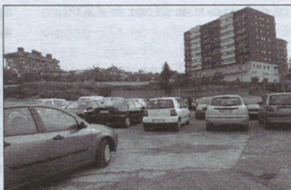
La futura torre del Palau tendrá una altura similar a los edificios del fondo.

Salvo este cambio de ubicación de la torre sobre la planta baja del edificio, el resto del proyecto apenas sufrirá modificaciones. El impacto visual será fuerte y para atenuarlo la carcasa del edificio será básicamente acristalada, en conjunto con los diversos edificios de oficinas que en esta zona también lo son, aunque evidentemente más reducidos. En el sótano del Palau de Justicia habrá un parking exclusivo para los magistrados y los furgones policiales que lleven a los detenidos para las preceptivas declaraciones, pero no será de uso restringido para los funcionarios, abogados y procuradores, y ni mucho menos para el público en general.