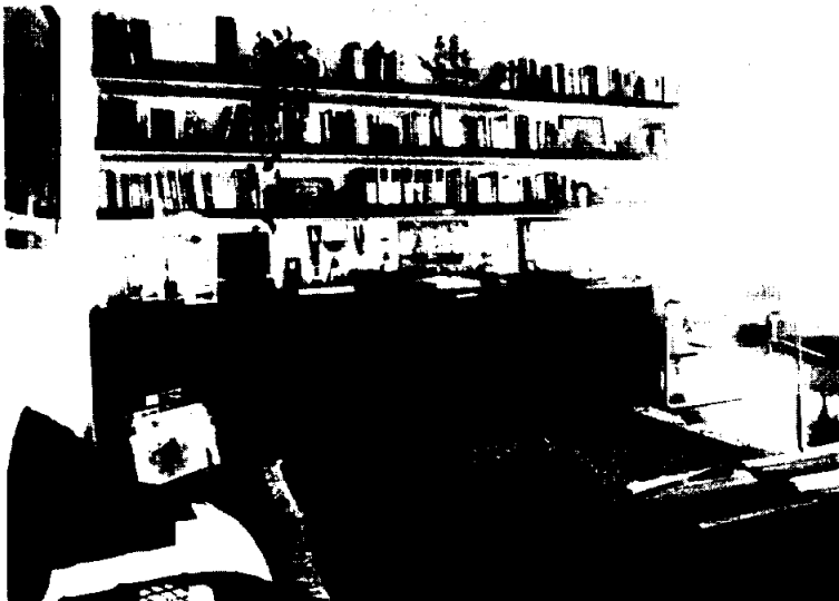
Zona biblioteca-lectura a nivel superior. Estantería de obra con sobre de madera y un sólo bloque inferior suspendido en la pared.