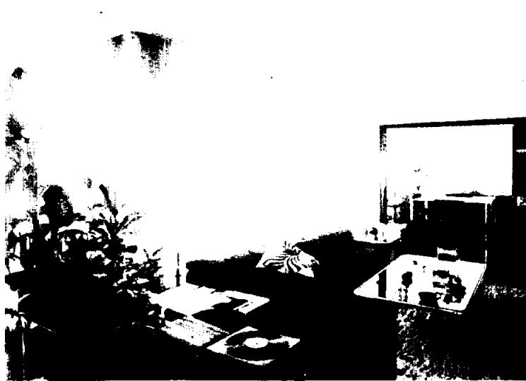
Zona de estar a nivel inferior, comunicado al comedor mediante puerta corrediza.