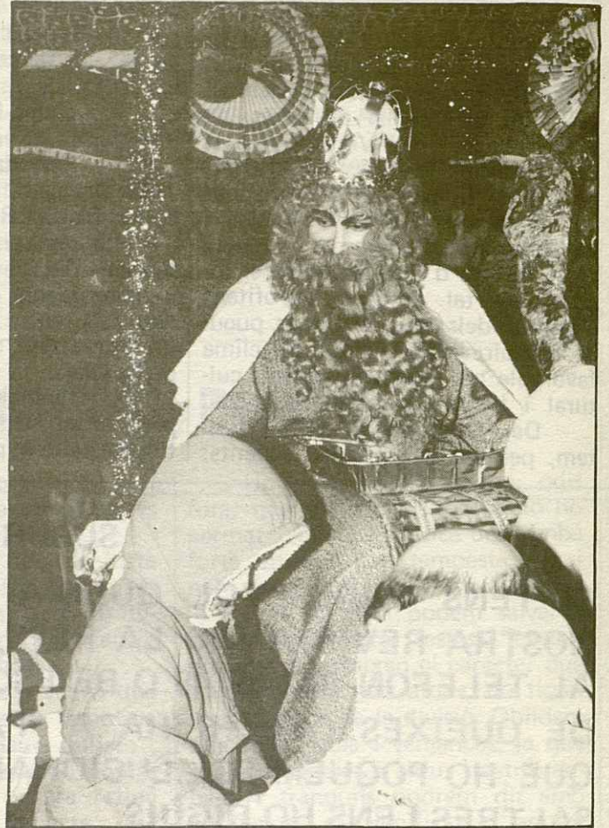
En les fotografies podem veure Ses Majestats Illurant caramels als infants de La Roca. Ses Majestats arribaren al nostre poble en una majestuosa Cavalcada, precedits de la Banda de Majorettes de La Roca i foren rebuts per una gran multitud d'infants.