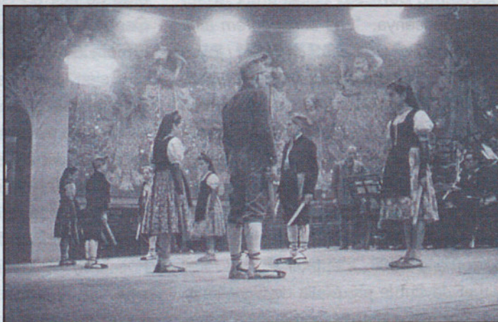
Integrants de l'Esbart al Palau de la Música de Barcelona el 1945.

1932, on s'anunciava la representació, i a la crònica del 15 de gener del 1933: "Seguint la vella tradició nadalenca, l'Agupació Joventut Artística del Centre Catòlic, oferirà extraordinàries representacions del grandios espectacle "Els Pastorets" de Folch i Torres, avui diada de Nadal a les quatre de la tarda, demà festa de Sant Esteve, i la diada de Cap d'any. Encara que sempre la Joventut