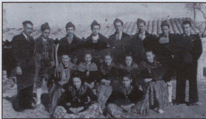
Alguns dels integrants de l'Esbart l'any 1941.