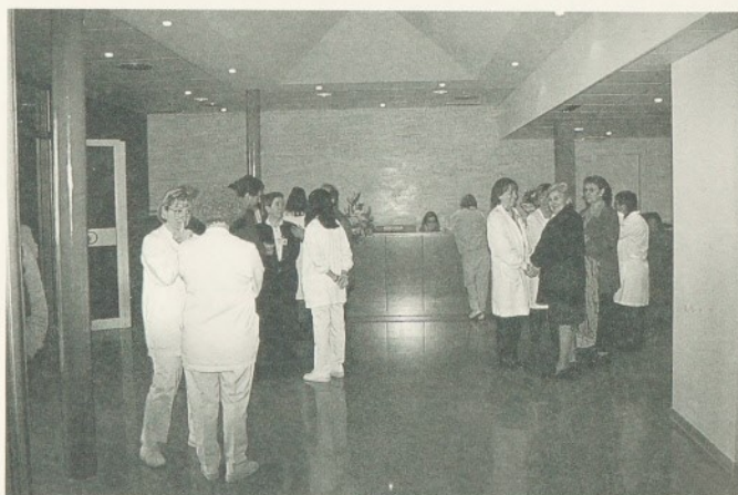
Imatge de la nova zona de recepció.