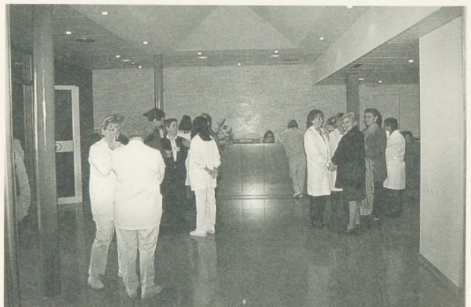
Imatge de la nova zona de recepció.