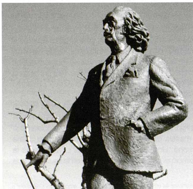
Estàtua de la figura de Salvador Dalí i Domènech al passeig de Cadaqués.