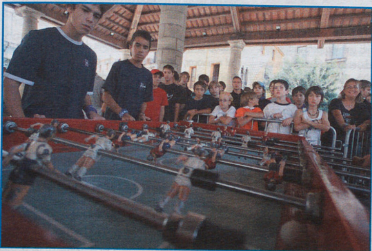
El fútbolín fue para... los Blaus.