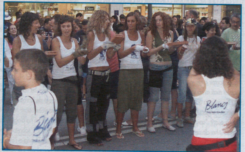
La pasada de adultos de rajesles fue para... los Blancs.