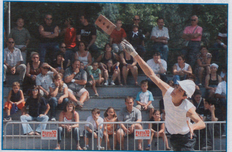
El lanzamiento de rajesles para... los Blaus.