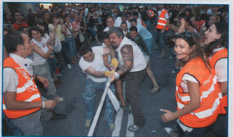
La estirada de cuerda de los adultos fue ganada por... los Blancs.