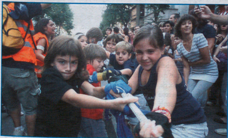
La estirada de cuerda infantil fue de... los Blaus.