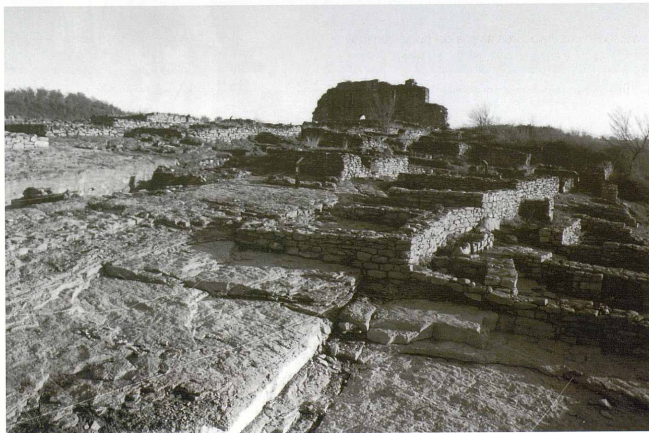
Jaciment arqueològic de l'Esquerda de les Masies de Roda