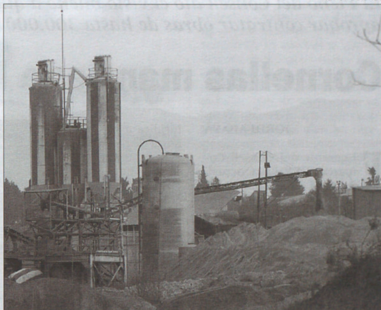
Zona de Can Falgar, en Llerona, donde se ubicará el parque.