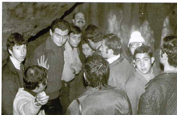
1er. Congrés Nacional d'Espeleologia a la cova del Salnitre (Montserrat).

L'any 2004 la Junta Directiva de l'Agrupació en reconeixement a la seva extensa tasca realitzada al front de l'Agrupació Excursionista de Granollers li va atorgar la Placa d'Honor de l'Entitat.