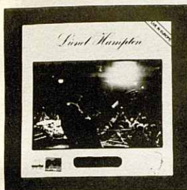
LIONEL HAMPTON "Live in Europe" Marfer Mt 40.508 S