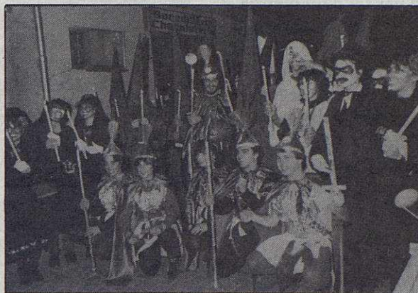
Rua del Carnaval de l'any 85

Granollers. Xocolatada i Ball de Donzelles. Organitza: Casino de Granollers. Migdia a les dotze. Casino de Granollers. Audició de Sardanes amb la cobla Costa Daurada. Organitza: Agrupa-