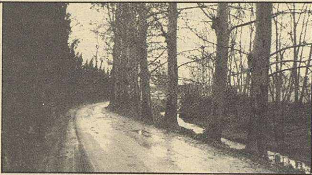
Camino del Barrio de Lourdes