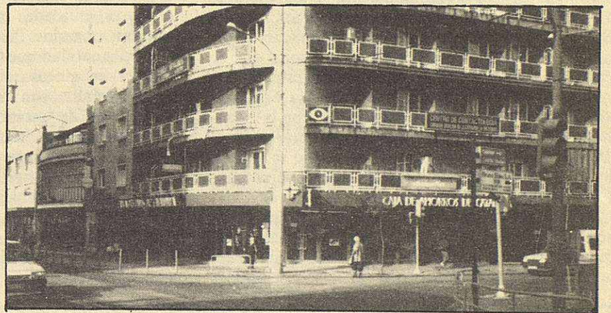
El Centro Dental se encuentra en la calle Cayetano Vínzia, 1.º, Escalera B, 1.º-2.º

—Tanto la salud dental como la información que sobre el tema se tiene en Mollet ha mejorado mucho en los últimos años, existe un gran deseo en poder disfrutar de una boca sana, cuidada, y a ser posible bonita. Se tiene empeño en salvar los dientes dándoles el valor que realmente tienen, se plantean, no ya la solu-