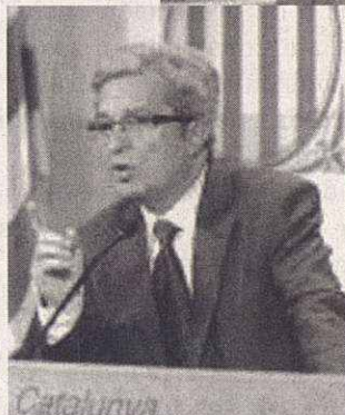
Jordi Solé Tura (arriba) y Joan Saura serán los dos grandes protagonistas de éste día

ciudad ante miles de personas llegaron al teatro municipal de Can Gomà donde tuvo lugar el acto principal para conmemorar el Milenario.