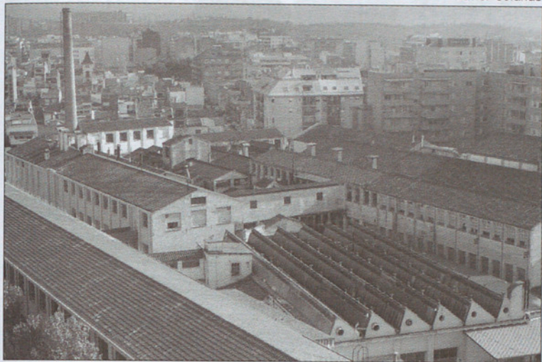
Vista de Roca Umbert desde el "rascacielos".