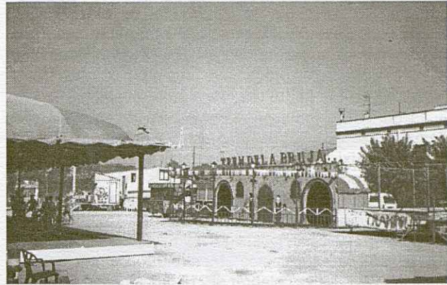
Aquest any la fira s'ubicà a la plaça St. Jordi.

Un cop tothom hagué sopat hi havia diversos actes als quals poder-lo pair: pels joves, concert hardcore o cinema jove amb la pel·lícula "Transporting"; pels no tan joves Ball de Nit amb el conjunt Orgue de Gats al pati de l'IES; i pels joves i no tan joves el concert que va oferir el grup Xarop de Canya a la plaça de l'església.