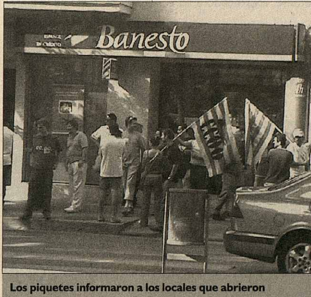
Los piquetes informaron a los locales que abrieron