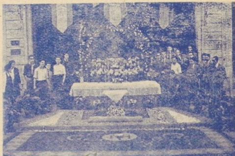
Per Corpus sap donar exemple d'atractiva devoció fent altars de «filgrana» al llarg de la processó.