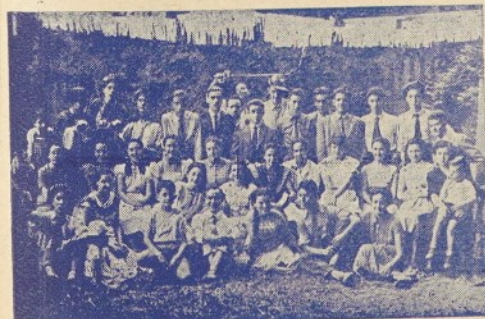
Quan vingué la Primavera amb la llum d'un bell matí féu una festa encisera l'Olimpic granolleri.