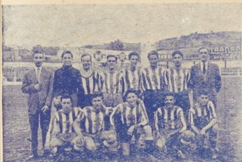
En quant al Futbol veureu que els «Olimpics» de Granollers conquisten per tot arreu primers trofeus i llores.