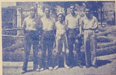
I amb un gest talment helènic, aquests «Olimpics» trempats, se'n van de S'Agaró a Roses valents i disciplinats.