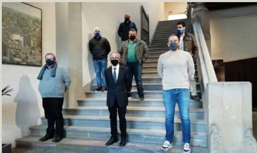
Responsables del Club Natació Granollers i de l'Ajuntament, després de la presentació del conveni

L'Ajuntament farà obres d'adequació i millora de l'accessibilitat i la seguretat de les piscines municipals de Granollers per valor de 4.000.000 d'euros, amb la construcció de dos nous vasos de piscina, noves instal·lacions de filtratge, tractament d'aigua i climatització. Part de la inversió necessària per fer possible aquest projecte, 1,6 milions d'euros, ja s'inclou al pressupost municipal per al 2021 aprovat al ple municipal. Per la seva banda, el Club Natació Granollers, que gestiona les piscines, aportarà 615.000 euros per a la construcció de nous vestidors i un ascensor. L'equipament és de titularitat de l'Ajuntament i el Club Natació de Granollers en gestiona els serveis des de 2002 i la concessió acaba el 2027.