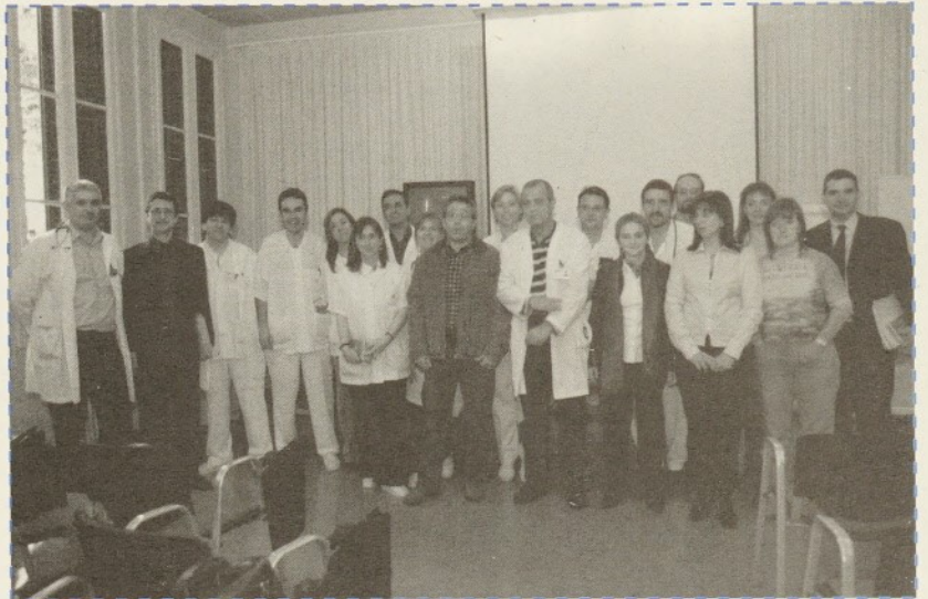
Una imatge de la presentació de la guia amb alguns dels seus autors

L'ànim d'aquest manual de butxaca és que sigui una eina pràctica (d'aquí el seu format) i de fàcil maneig en la que qualsevol metge o sanitari no especialista pugui consultar dubtes o situacions derivades de la infecció VIH. Urgencias y VIH ha tingut un èxit de difusió en la seva edició inicial i,