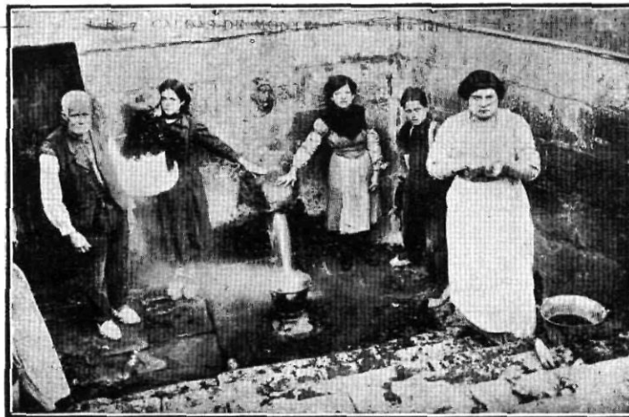
La Font del Lleó abans d'ésser restaurada

Es tan rica i abundosa la deu d'aigües minerals termals amb que la naturalesa ha dotat aquesta vila, que ademés dels hotels-balnearis amb manantial propi i abundant, hi ha, disseminades per la població, tres fonts públiques i contínues que els veïns usen en l'economia rural i domèstica, essent la principal la del Lleó, situada a la plaça avui de la República.