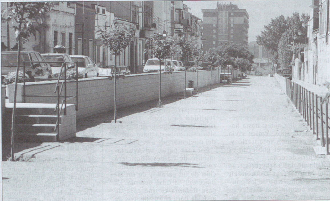
Imagen del nuevo paseo.