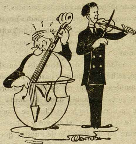
Contraste en los músicos